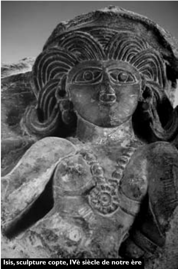
Isis, sculpture copte, IV e siècle de notre ère

S'il y a une chose dont le monde a besoin au début de l'ère nouvelle, c'est bien d'hommes et de femmes témoignant d'une véritable vie spirituelle, autrement dit d'une vie animée par l'esprit, attitude qui se manifeste parfois d'une manière subtile dans la façon de résoudre les problèmes ou de parler et d'agir.